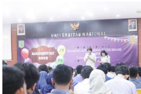
Management Day 2019