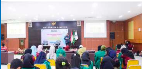
Pelatihan Kepemimpinan dan Manajemen Mahasiswa Menyokong Kepemimpinan Bangsa Yang Berkarakter dan Beretika (2019)