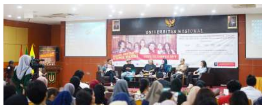
Acara berkonsep silaturahmi budaya dan akademik beris: - Diskusi Panel Bertajuk "Prasangka Buruk & Hoaks adalah musuh bersama" - Pemutaran Trailer Film Komedi Kritik Sosial Berjudul "Dilarang Menyanyi di kamar mandi" (2019)