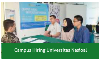
Campus Hiring Universitas Nasioal