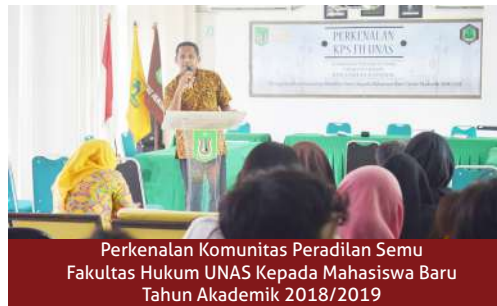
Perkenalan Komunitas Peradilan Semu Fakultas Hukum UNAS Kepada Mahasiswa Baru Tahun Akademik 2018/2019