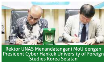
Rektor UNAS Menandatangani MoU dengan President Cyber Hankuk University of Foreign Studies Korea Selatan