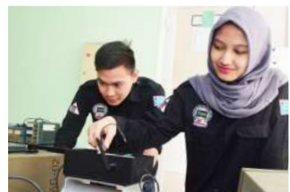
Laboratorium Teknik Elektro