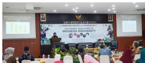
Seminar Internasional Biodiversity (Oktober 2019)