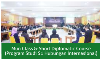
Mun Class & Short Diplomatic Course (Program Studi S1 Hubungan Internasional)