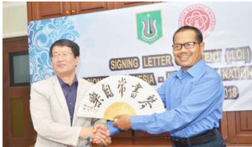
Signing Letter of Intent (Loi) antara Kyungpook National University (KNU) , Korea Selatan dengan Fakultas Sastra Universitas Nasional