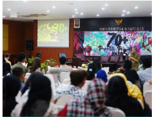
70+ Peneliti Primata UNAS (2019)