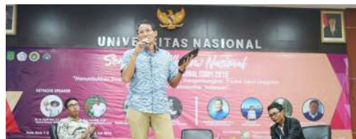
Kewirausahaan Nasional EXPO ISMPI 2019 Universitas Nasional