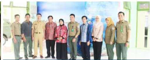
Universitas Nasional (UNAS) melakukan pertemuan kerja sama dan Memorandum of Understanding (MoU) dengan Pemerintah Daerah (Pemda) Kabupaten Selayar, 16 Juli 2018