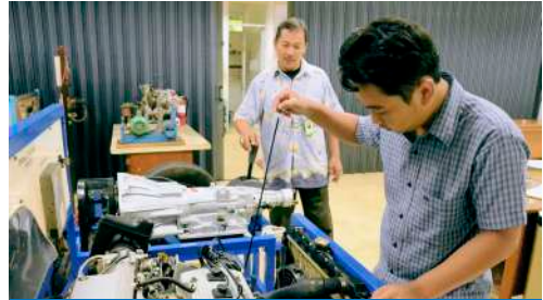
Laboratorium Teknik Mesin