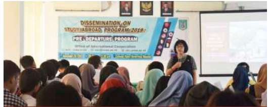
Dissemination on Study Abroad Program 2019: Pre-Departure Program, Office of International Cooperation (26 November 2019)