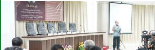
Seminar "Politik Pendidikan di Indonesia: Tantangan dan Peluang Era Revolusi 4.0" (2019)