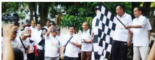
Kegiatan Fun Walk & Fun Run dalam Perayaan Dies Natalis UNAS ke 70 tahun Connecting Generation (Oktober 2019)