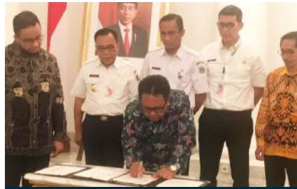
Penandatanganan MoU tentang Pembinaan dan Pengembangan Sumber Daya Manusia, Objek dan Daya Tarik Wisata serta Pelesetarian Lingkungan Hidup di Kabupaten Administrasi Kepulauan Seribu Jakarta, 4 Desember 2019