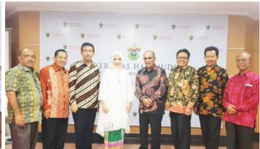
Foto Bersama Rektor UNAS & Rektor Hasanudin Beserta Tim Usai Penandatanganan MoU