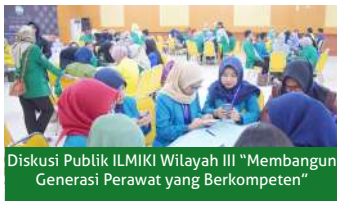
Diskusi Publik ILMIKI Wilayah III "Membangun Generasi Perawat yang Berkompeten"