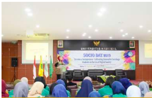
Socio Day 2019

"Become a Sociopreneur: Cultivating Innovative Sociology Students in the Era of Digital Society"