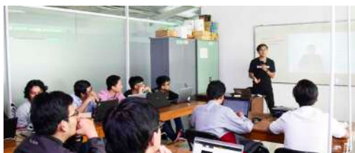
Workshop UI dan UX FTKI (2019)