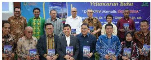
Duta Besar Indonesia untuk Ukraina yang sekaligus menjabat sebagai Guru Besar di Universitas Nasional Yang Mulia Prof. Dr. Yuddy Chrisnandi SH, ME meluncurkan buku "Dari KYIV Menulis Indonesia" (Oktober 2019)