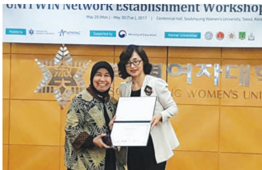
Women Empowerment Through ICT and Leadership Education di Korea Selatan (Juni 2017)