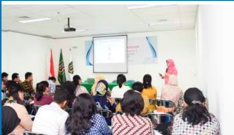
Pelatihan Preceptorship Bagi Perawat Gelombang ke-2 (Oktober 2019)