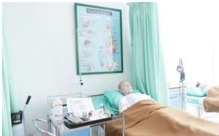
Laboratorium Ilmu Kesehatan