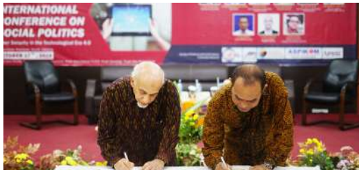
FISIP UNAS Bekerja sama dengan Badan Keahlian DPR RI Gelar International Conference on Social Politics, Oktober 2019.