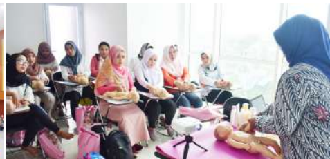
FIKES adakan Training Baby Spa dan Massage Untuk Bidan (2018)