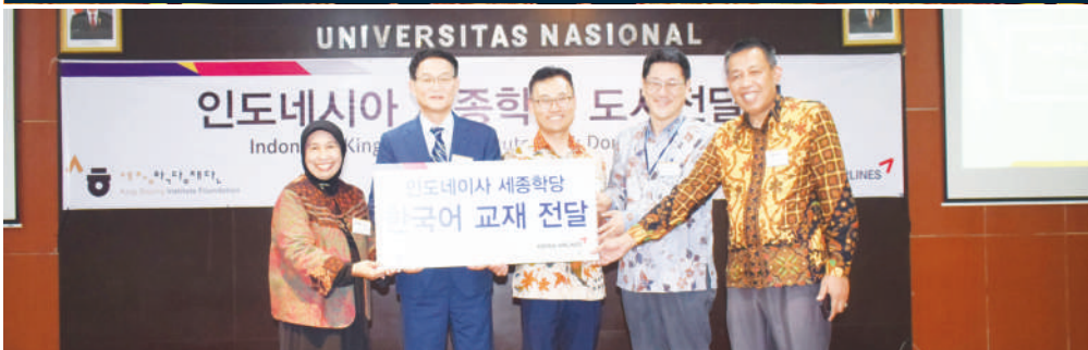
Seminar Penyerahan Buku dari King Sejong University (Desember 2017)