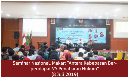
Seminar Nasional, Makar: "Antara Kebebasan Berpendapat VS Penafsiran Hukum" (8 Juli 2019)

Prospek karier bagi alumni Fakultas Hukum tentu sangat luas dan meliputi seluruh aktivitas kehidupan masyarakat baik secara publik maupun secara privat. Kebutuhan akan lulusan hukum semakin hari semakin bertambah, terutama dalam mengisi jabatan-jabatan publik di pemerintahan maupun jabatan pada kantor-kantor swasta. Lulusan hukum bisnis, sangat dibutuhkan diberbagai lembaga pemerintahan maupun swasta seperti perbankan, perusahaan-perusahaan tambang, serta lembaga Pasar Modal maupun Otoritas jasa Keuangan. Pada umumnya lulusan fakultas hukum memiliki karir sebagai Aparat Penegak Hukum (Polisi, Jaksa, Hakim, Advokat), konsultan hukum, Praktisi Hukum, Analisis Hukum Bisnis, Kurator, Para Legal. Dosen, Praktisi Hukum dan Peneliti.