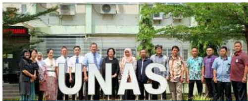
Keberlanjutan Kerjasama Internasional Universitas Nasional dengan Guangxi Universiti (GXUN) China (2019)