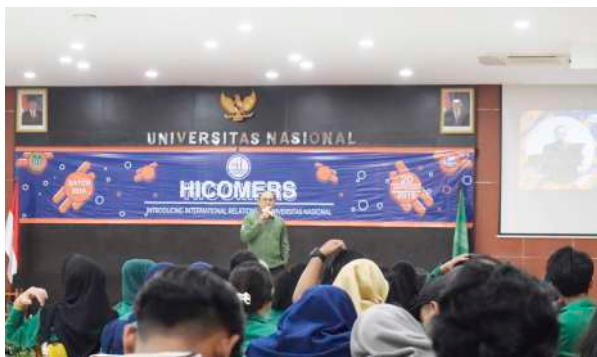
HICOMERS "Introducing International Relations of Universitas Nasional (2019)"