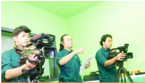
Praktikum Shooting Mahasiswa Program Studi Ilmu Komunikasi di Laboratorium UNAS TV