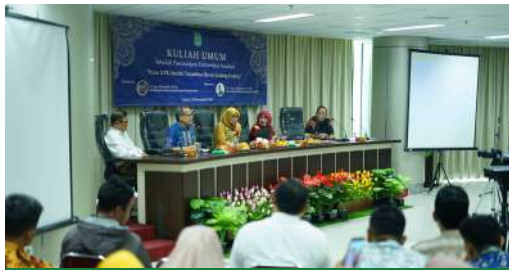
Kuliah Umum Magister Manajemen "Peran KPK Setelah Terjadinya Revisi Undang-Undang" (22 November 2019)