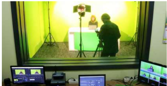
Laboratorium UNAS TV