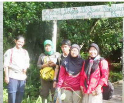
Penelitian Bioprospeksi Dosen dan Mahasiswa Fakultas Biologi di Pulau Seribu (2019)