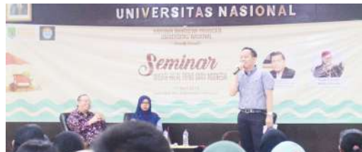
Seminar Wisata Halal Trend Baru Indonesia (2018)