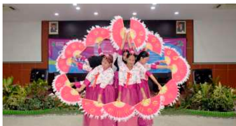
Gelar Budaya Asia 2019 (Oktober 2019)