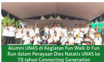
Alumni UNAS di Kegiatan Fun Walk & Fun Run dalam Perayaan Dies Natalis UNAS ke 70 tahun Connecting Generation