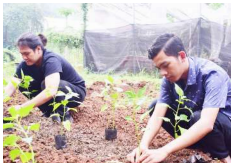
Praktikum Mahasiswa Program Studi Agroteknologi di Kebun Percobaan-Bambu Kuning

Pengusaha, Perkebunan baik Pemerintah dan Swasta, Industri perbenihan, pupuk dan pestisida nasional dan multinasional, Dosen, Departemen di Pemerintahan Pusat dan Daerah, Bank-bank Pemerintah dan Swasta, Industri pangan, pakan, biodiesel, Perusahaan pertanian, Pemerintahan Daerah dengan dinas-dinas teknisnya, Konsultan pemerintah dan swasta.