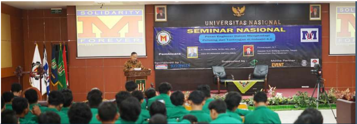
Seminar Nasional "Peran Engineer dalam Menghadapi Peluang dan Tantangan di Industri 4.0" (2019)