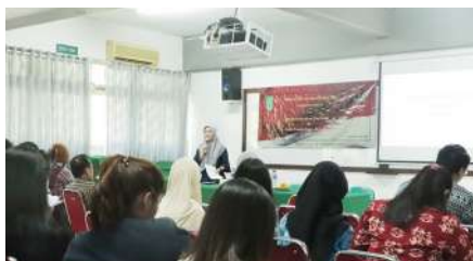
Diskusi Tahunan HIMASINA 2018/2019 UNAS "Berfikir Kritis di era Post Truth dan Kajian Wacana Sastra Post Colonial" (Juli 2019)

Pengajaran bahasa dan sastra yang berkualitas dihasilkan oleh Program studi yang mempunyai program pembelajaran yang berkualitas pula. Oleh sebab itu, kekhususan ini mempunyai prospek kerja sebagai pengajar bahasa dan sastra di berbagai lembaga pendidikan, karena pelajaran bahasa Indonesia merupakan pelajaran yang wajib diselenggarakan di setiap jenjang pendidikan.