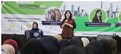
Seminar Accounting Fair 2019 "Menjadi Akuntan Yang Profesional di Era Revolusi Industri 4.0"