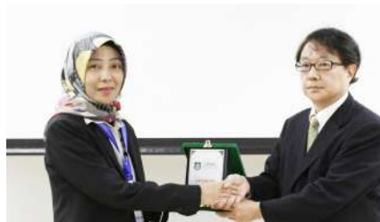
Universitas Nasional menjalin kerja sama internasional dengan Kogakuin University Jepang, 17 April 2018.