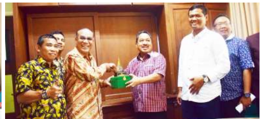
Universitas Nasional (UNAS) kedatangan kunjungan kerja sama dari Dewan Perwakilan Rakyat Daerah (DPRD) Kabupaten Tulang Bawang Provisi Lampung, 29 Maret 2018

Universitas Nasional juga melakukan berbagai kerja sama di dalam negeri. Kerja sama yang dilakukan merupakan bentuk peran serta Universitas Nasional dalam membangun bangsa melalui peningkatan mutu sumber daya manusia. Kerja sama ini dilakukan dengan Universitas-universitas terkemuka di Indonesia, Kementerian Dalam Negeri, Kementerian Hukum dan HAM, Kementerian Perindustrian, Kementerian Pembangunan Daerah Tertinggal, Lembaga Ilmu Pengetahuan Indonesia (LIPI), Badan Nasional Penempatan dan Perlindungan Tenaga Kerja Indonesia (BPNP2TKI), Flora & Fauna International (FFI), BOS Foundation, World Wildlife Fund (WWF), Badan Narkotika Nasional (BNN), dan lain-lain.