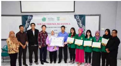
Penyerahan Beasiswa Korindo Indonesia kepada Mahasiswa/i Program Studi Bahasa Korea UNAS Tahun Akademik 2019/2020 (25 September 2019)