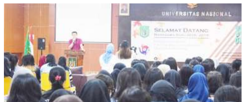
Penyambutan Mahasiswa Baru Program studi Bahasa Korea Tahun Akedemik 2018/2019

Penerjemahan (lisan maupun tulisan), Pendidikan (pengajar,peneliti), Pemandu Wisata, Personal assistant , Bidang-bidang yang berkaitan dengan keKoreaan.