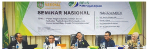
Seminar Nasional "Peran Negara Dalam Jaminan Sosial Terhadap Perlindungan Ketenagakerjaan untuk Solusi Masa Depan Pekerja Indonesia" (2017)