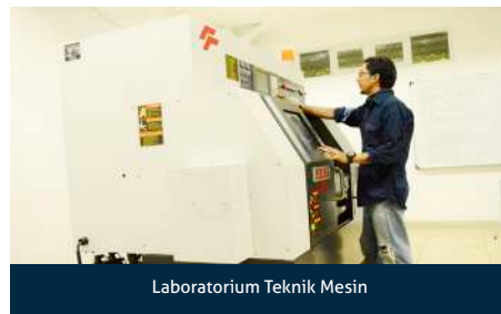
Laboratorium Teknik Mesin

Alumni Jurusan Teknik Mesin Universitas Nasional telah tersebar di berbagai bidang pekerjaan, baik dalam bidang pendidikan, penelitian maupun industri. Mereka menduduki berbagai jenjang posisi hingga manajer di berbagai instansi pemerintah, perusahaan swasta maupun BUMN seperti: PLN, PERTAMINA, TRAKINDO UTAMA, REKAYASA INDUSTRI, PETROCHINA, TAIYO SINAR RAYA TEKNIK, JGC Indonesia, TRIPATRA ENGINEERING, INDUSTRI OTOMOTIF dan Lembaga penelitian pemerintah seperti BPPT, BATAN dan lain-lain. Selain itu, lulusan teknik mesin dapat pula berperan dalam bidang kewirausahaan dalam bidang teknik mesin maupun Konsultan Mechanical & Elektrical.