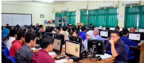
Laboratorium Jaringan Komputer