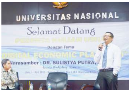
Kuliah Umum "Digital Economic Platform" (11 April 2018)

Bidang Marketing & sales, export-import, personalia (HRD), research & development, pendidikan & Pelatihan, produksi/operasional, quality control, purchasing, keuangan pada level staf, supervisor, manajer hingga direktur pada berbagai perusahaan swasta, instansi pemerintah hingga wirausaha.