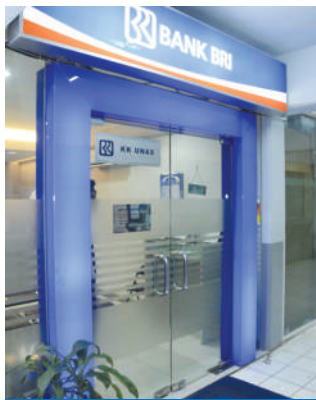
Bank BRI Kantor Kas UNAS