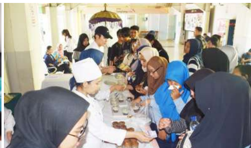
Bazaar In Occasions to Wellcome Kartini's Day (2018)

Lulusan sarjana pariwisata mampu menguasai, menerapkan, dan mengembangkan bidang pariwisata serta memiliki karakter dan integritas untuk berkontribusi aktif dalam masyarakat untuk mengembangkan pariwisata baik secara sains dan bisnis. Dengan mengacu pada Degree Outcome dan Profile Lulusan yang telah ditetapkan tersebut dapat diharapkan bahwa lulusan Prodi pariwisata berperan aktif dalam mengembangkan bidang pariwisata untuk memenuhi kebutuhan masyarakat yang dalam upaya peningkatan kesejahteraan ekonLulusan Prodi pariwisata dengan Profile tersebut dapat mengisi bidang profesi yang seluas-luasnya terkait dengan bidang pariwisata antara lain: General Manager Hotel, Event Organizer employee, Travel Agent Excecutive Director, Hotel Director of Human Resources, Konsultan destinasi pariwisata, konsultan pariwisata, birokrat di kementerian pariwisata dan lain-lain.