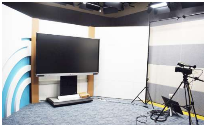
Studio Cyber Edu Inkor Universitas Nasional