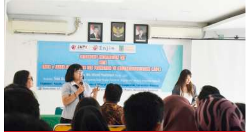
Internship Information Day with Enjin & Japan Association For Promotion of Internationalization (JAPI) (September 2019)

Penerjemah ( Translator ), Penyunting ( Editor ), Penulis ( Writer ), Staff Kedutaan ( Staff of Embassy ), Dosen ( Lecturer ), Pengisi Suara ( Dubber ), Hubungan Masyarakat ( Public Relations ), Penyiar ( Broadcaster ), Pengajar ( Teacher ), Wirausaha ( Entrepreneur ), Pemandu Wisata ( Guide ), Sekretaris ( Secretary ), Pembawa Acara ( Master of Ceremony ), Pelatih Bahasa Inggris ( Trainer ).