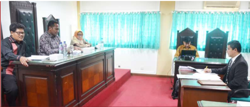
Berlangsungnya Sidang Skripsi Program Studi S1 Hukum Prof. Dr. Yuddy Chrisnandi, M.E. (Dubes RI untuk Ukraina).