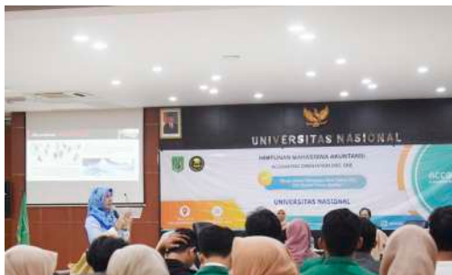
Seminar Accounting Orientation Disc. One "Muda Dalam Berkarya, Ceria Dalam Diri, Dan Kreatif Dalam Berfikir" (September 2019)

Konsultasi Pajak, Tax Specialist , Akuntan Manajemen, Auditor Internal, Auditor Akuntan Publik, Analisis Sistem / Proses Bisnis Dan Pengembang Sistem Informasi Akuntansi. Semua BUMN, perusahaan swasta dan organisasi non pemerintah membutuhkan seorang akuntan untuk mengelola urusan keuangan lulusan program studi ini banyak dibutuhkan.