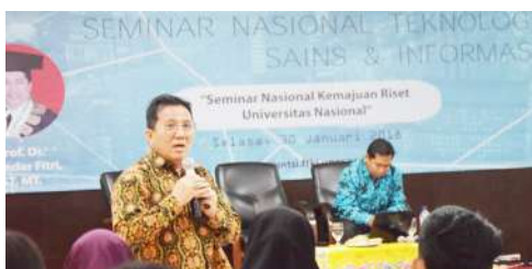
Seminar Nasional Teknologi Sains & Informasi "Seminar Nasional Kemajuan Riset Universitas Nasional" (2018)

Lulusan yang dapat bekerja dalam bidang desain jaringan Telekomunikasi, melaksanakan, dan mengelola berbagai jaringan telekomunikasi yang digunakan dalam sebuah organisasi/perusahaan. Jaringan ini termasuk jaringan data, seperti Internet, jaringan suara, seperti teknologi telekonferens, dan komunikasi video, seperti video conference.