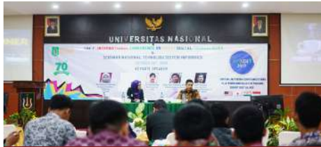
Seminar Nasional Teknologi Sistem Informasi (Oktober 2019)