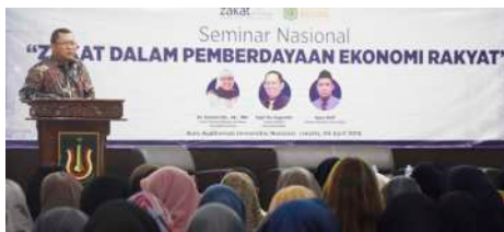
Seminar Nasional "Zakat Dalam Pemberdayaan Ekonomi Rakyat" (9 April 2019)