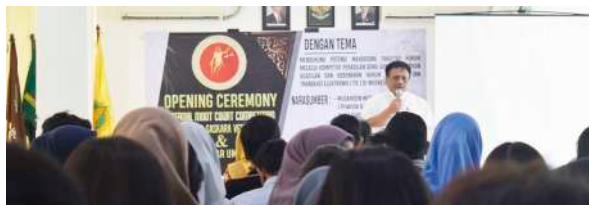
Opening Ceremony Internal Moot Court Competition Piala Saskara Veda I dan Seminar Umum "Mendukung Potensi Mahasiswa Fakultas Hukum Kompetisi Peradilan Semu Guna Mewujudkan Keadilan dan Kebenaran Hukum Informasi dan Transaksi Elektronik (ITE) di Indonesia" (2019)

Desain kurikulum program kekhususan hukum pidana dengan suatu tujuan agar mahasiswa mampu menguasai dasar-dasar ilmiah dan praktis di bidang hukum pidana, nasional maupun internasional, serta mampu menerapkan dan mengembangkannya secara praktis dalam kehidupan sosial masyarakat. Materi ilmu hukum pidana yang dipelajari meliputi; hukum penintensier, gugurnya hak menuntut dan menjalankan pidana, tindak perdagangan narkoba, sistem peradilan pidana anak, kriminologi dan viktimolgi, tindak pidana di bidang ekonomi, hukum forensik, dan perbandingan hukum pidana.