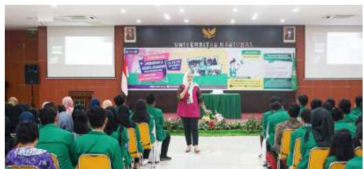
Pengenalan Lingkungan & Budaya Akademik Untuk Mahasiswa Baru Semester Ganjil Tahun Akademik 2019/2020 (September 2019)