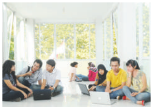
Wifi di kampus UNAS