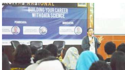
Building Your Career With Data Science (2018)