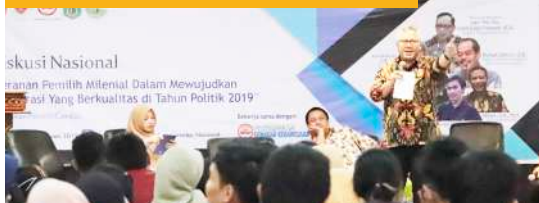
Diskusi Nasional "Peranan Pemilih Milenial dalam Mewujudkan Demokrasi Yang Berkualitas di Tahun Politik 2019"