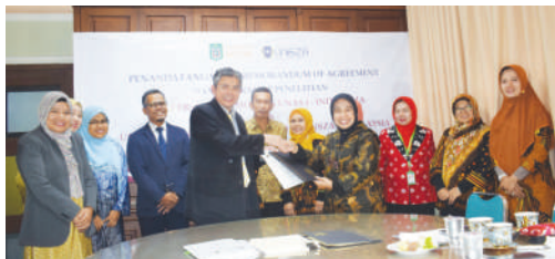
Gandeng UniSZA Malaysia, UNAS Perkuat Kerja sama di Bidang Penelitian dan Workshop, 26 Juni 2018.