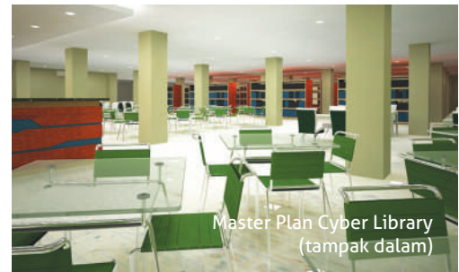
Master Plan Cyber Library (tampak dalam)