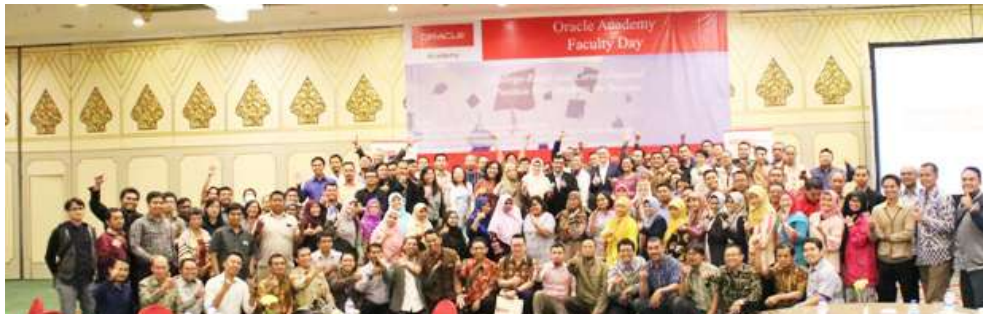
FTKI UNAS Jalin Kerja sama dengan Oracle Academy, Agustus 2018