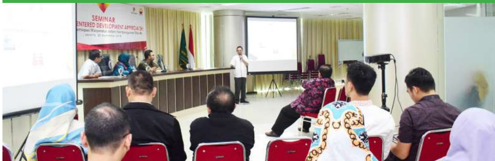
Seminar "People-Centered Development Approach: Mendorong Partisipasi Masyarakat dalam Pembangunan Daerah" (20 September 2018)

*Kelas Reguler Pagi akan dibuka apabila pendaftar mencapai min. 5 orang