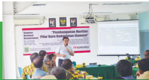
Seminar Kemaritiman "Membangun Maritim: Pilar Baru Kedaulatan Ekonomi" (11 Oktober 2018)