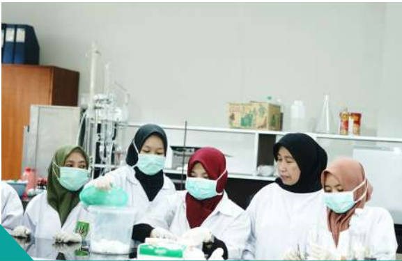
Penelitian Biologi (Sample Ikan Gabus), 2019