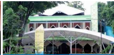
Masjed Sutan Takdir Alisjahbana