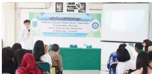
Mahasiswa Guangxi for Nationalities Program Gelar Bersama Sastra Indonesia dan Manajemen di UNAS (28 September 2018)