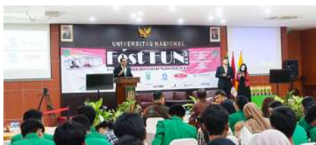
Fest Fun UNAS 2019