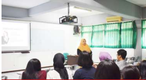
Mahasiswa Sastra Inggris Sedang Mengikuti Seminar Public Speaking yang disampaikan dari Narasumber