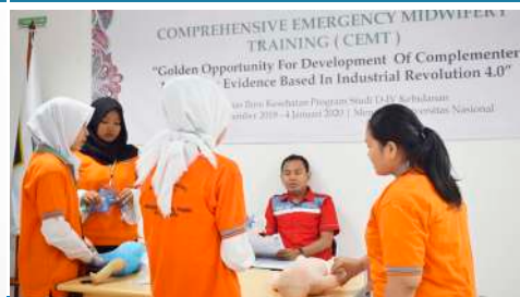
Comprehensive Emergency Midwifery Training (CEMT), Desember 2019 - Januari 2020