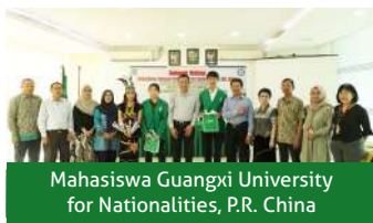
Mahasiswa Guangxi University for Nationalities, P.R. China

Sistem pendidikan di Universitas Nasional menekankan pada pembekalan kompetensi yang mengkombinasikan metode pembelajaran reguler dan metode student centered learning . Didukung ketersediaan akses internet dan sarana multimedia, para dosen berperan sebagai fasilitator dan moderator untuk memotivasi mahasiswa agar aktif mencari informasi, mendiskusikan studi kasus dan mahir mempresentasikan solusi masalah. Setiap tahun mahasiswa Universitas Nasional meraih prestasi pada ajang kompetisi baik ilmiah maupun ekstrakurikuler pada tingkat regional, nasional dan internasional.