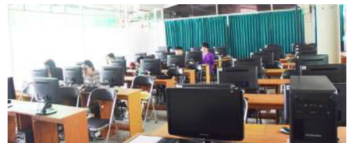
Lab. Komputer Statistik Akuntansi