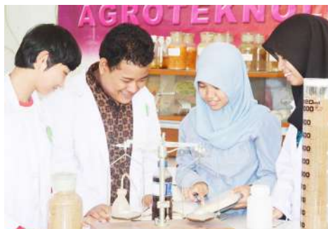
Praktikum Mahasiswa Program Studi Agroteknologi di Laboratorium Pertanian