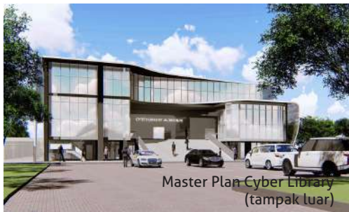
Master Plan Cyber Library (tampak luar)