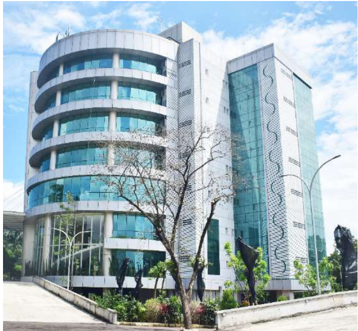
Menara Universitas Nasional Kampus Sekolah Pascasarjana Jl. R. M. Harsono Ragunan, Jakarta Selatan